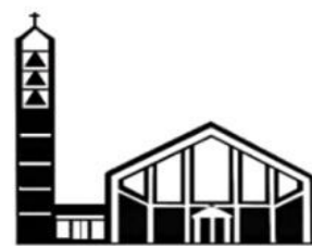
St. Karl Borromäus